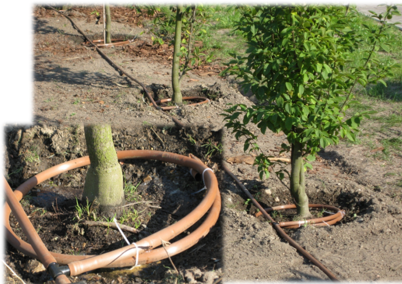
Seite 8 „Wassermanagement“