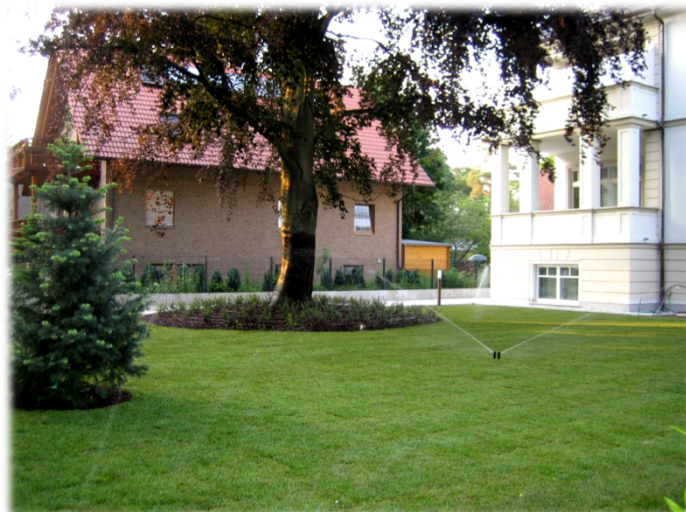
Seite 7 „Wassermanagement“